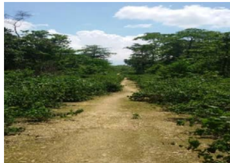
Gambar 2. Jalan Usaha Tani

lahan pertanian lama yang telah memiliki jalan yang baik dalam mendukung kegiatan produktif petani. Dengan corak pertanian yang masih berpindah-pindah menyebabkan program-program pembangunan infrastruktur menjadi tidak tepat guna hingga pemborosan sumberdaya. Olehnya perlu ada kebijakan spasial untuk dapat menyelesaikan masalah ini agar pembangunan infrastruktur dapat memberi manfaat secara optimal bagi masyarakat sebab tujuan akhir dari pembangunan perdesaan adalah membangun manusia perdesaan seutuhnya. Berikut gambar jalan-jalan usaha tani yang dibangun oleh pemerintah desa yang telah ditumbuhi oleh tanaman liar dan tidak berdayaguna dan berhasil guna bagi pertanian.