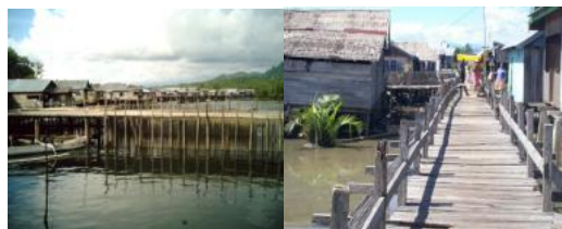
Gambar 4. Kondisi Permukiman, Orang Bajo' di Perairan di Sulawesi Tengah