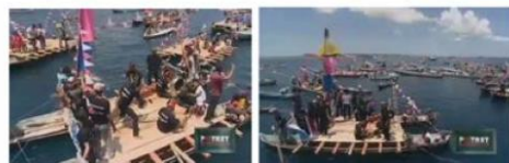
Gambar 6. Perahu Leppa yang digabung untuk membentuk panggung festival

Dalam mengelaborasi leppa, Orang Bajo membentuk ruang baru yang terdiri dari dua leppa yang diatasnya disusun papan untuk membentuk ruang yang lebih besar dari satu leppa. Ruang baru ini dibentuk untuk mengikuti kebutuhan Orang Bajo dalam melakukan pementasan di festival Orang Bajo.