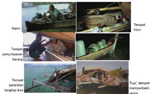
Gambar 4. Aktivitas Orang Bajo menyesuaikan bentuk ruang di leppa. Posisi tidur, letak dapur, tempat menyimpan barang, hingga tempat memperbaiki jaring.

ruang leppa yang mengharuskan mereka yang mengikuti ruangnya.