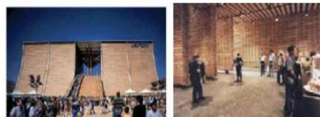
Gambar 2. Tadao Ando Japan Pavilion, Sevilla Expo 1992. Interior view Peter Zumthor's Swiss Pavillion Expo 2000.

EA dalam bentuk Event , objek arsitekturnya terbentuk dari struktur yang terdiri dari tenda, kain terpal, atau pneumatic structure , dll, sering digunakan dalam rangka piknik, party , tempat berkumpul, dan pasar. Tipe ini sering juga disebut dengan portable architecture . Karena objek arsitektur ini berada pada suatu tempat dengan waktu yang terbatas, serta dapat dipindahkan atau berpindah dan dapat beradaptasi pada perubahan lingkungan.