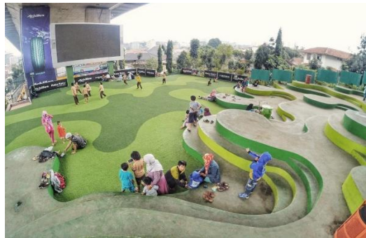
Gambar 2. Potret Taman Film Bandung

Sebagai contoh, Taman Film sering digunakan sebagai tempat berkumpul masyarakat Kota Bandung untuk menikmati pertunjukan film. Desain amphitheater yang menarik dan dinamis memberikan bentuk ruang yang lebih luas untuk duduk saat kondisi sangat ramai pengunjung.