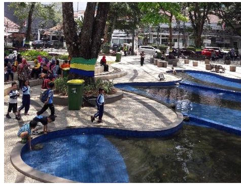
Gambar 4. Potret Taman Air Balaikota Bandung

Aspek Lokasi Taman , sebagai karakteristik ketiga dominan di taman kota dapat dilihat dalam kutipan hasil kuesioner di bawah ini.