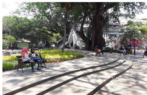
Gambar 5. Potret Taman Balaikota Bandung

Salah satu kriteria ruang terbuka yang ideal yaitu memiliki kedekatan dan kemantapan aksesibilitas, mudah dijangkau dengan jalan kaki, kedekatan dengan jalan besar, tidak dilalui kendaraan padat, atau kendaraan yang lewat dengan kecepatan lambat. (James, 2010). Taman Balai Kota Bandung berlokasi daerah pusat pemerintahan kota. Hal ini memberikan kemudahan bagi masyarakat yang memiliki aktivitas sehari – hari di daerah pusat kota.