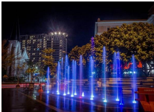
Gambar 6. Potret Taman Vanda Bandung

Bandung memiliki banyak sekali taman dengan konsep tematik. Desain taman yang menarik, memberikan tingkat kenyamanan dan kepuasan yang tinggi, menambah daya tarik, serta membuat masyarakat jadi lebih betah menghabiskan waktu berada di taman tersebut.